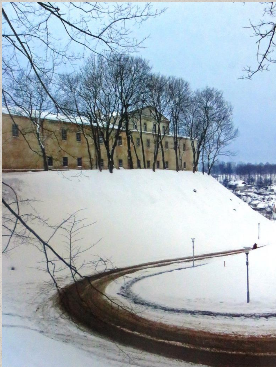
Иллюстрация 4. Старый замок, в стенах которого располагается Гродненский государственный историко-археологический музей. Государственный архив Гродненской области. Книга «Регион. Гродненская область. Время действий и преобразований». НСБ № 2154. С. 128.