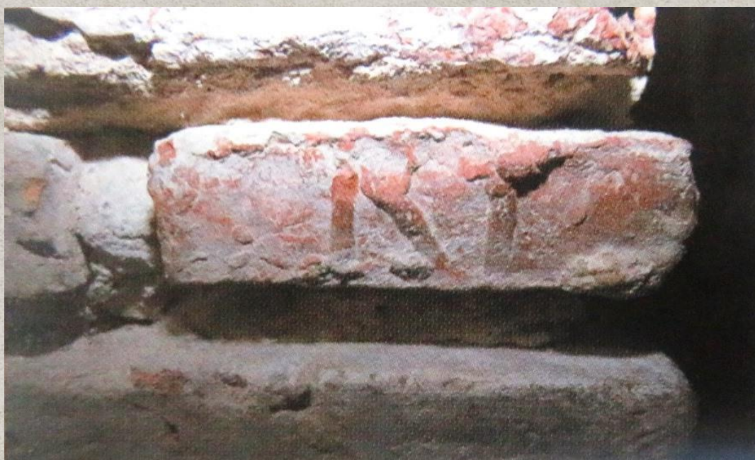
Иллюстрация 3. Фрагмент плинфы Нижней церкви со знаками. Государственный архив Гродненской области. Краткий очерк истории «Православные храмы Гродно». НСБ № 1875. С. 12.

XI-XIX веков. Был получен ценный и разнообразный археологический материал, благодаря чему появилась возможность изучить материальную культуру XI-XVIII веков древнего Гродно на этой территории. Было собрано огромное количество горшечного и коробчатого кафеля, неглазурованной и глазурованной посуды, изделий из стекла, металла, дерева, кости, а также строительных материалов XII и XV-XVIII веков. Значительно пополнилась коллекция находок конца X-XIV веков: берестяная грамота с княжескими знаками, орнаментальная накладка XII века (возможно, из интерьера Нижней церкви), костяная игральная фигурка, кусочки омофор XI-XII веков, различные ювелирные украшения. Учеными была собрана уникальная коллекция плинф (кирпичей) разных размеров и форм со знаками на торцах, а также глазурованных плиток для оформления фасада и пола церкви. (Иллюстрация 3)