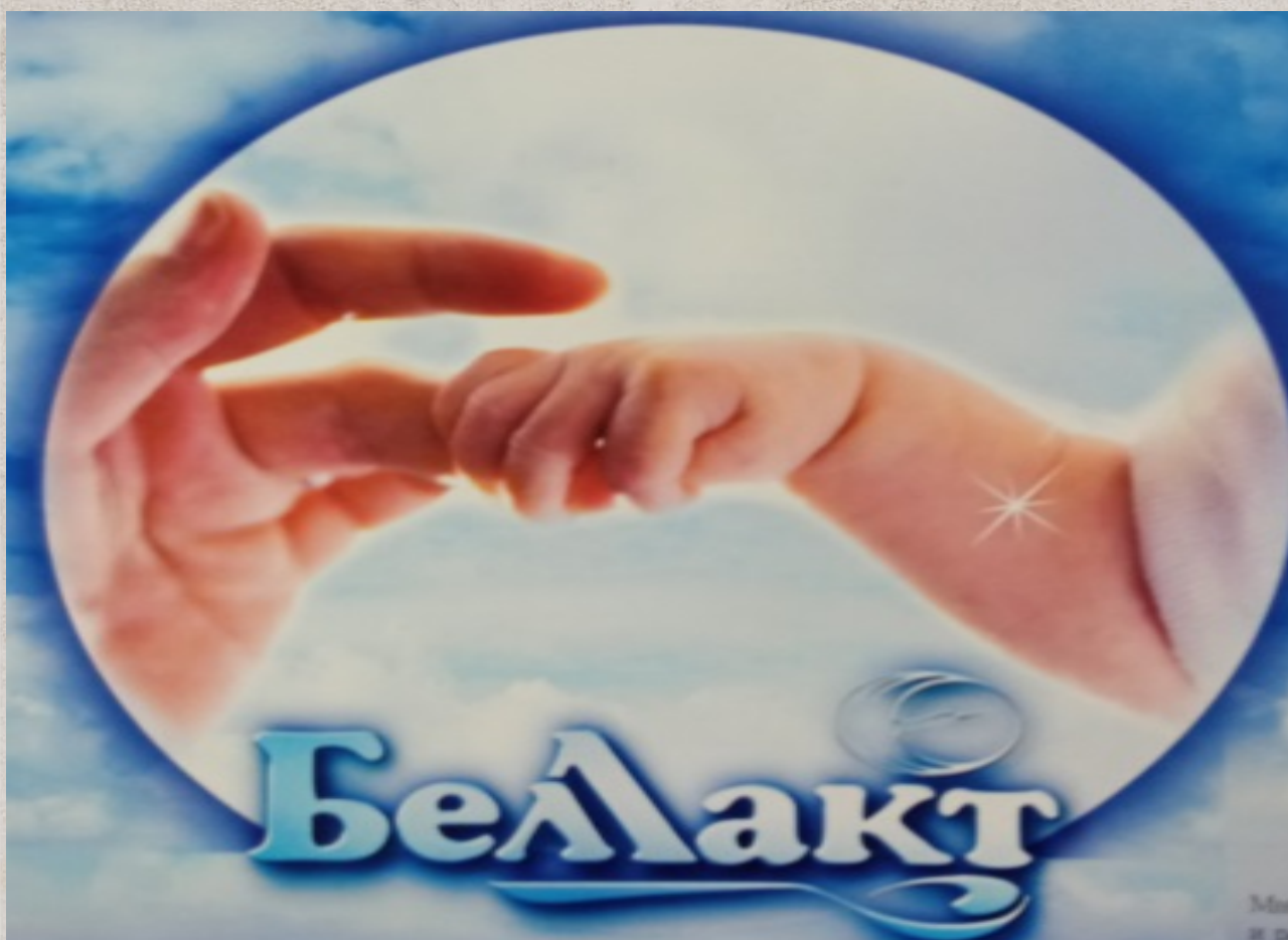
Иллюстрация 1. Фирменный логотип ОАО «Беллакт».

Волковысское ОАО «Беллакт» сегодня – это европейский уровень переработки молока, современные технологии, постоянный лабораторный и технологический контроль на всех стадиях производства – от сырья до готовой продукции. Все сухие продукты для питания детей с первых дней жизни, специализированные продукты для питания беременных и кормящих женщин, диетические продукты питания для взрослых и спортсменов создаются в тесном сотрудничестве с педиатрами и специалистами по питанию. Наряду с сухими продуктами предприятие производит и широкий ассортимент цельномолочной продукции. Вся продукция, изготавливаемая Волковысским ОАО «Беллакт», пользуется спросом не только на территории Беларуси, но и далеко за её пределами: в России, Молдове, Украине, Таджикистане, Венесуэле, Сирии. [1] (Иллюстрация 1)