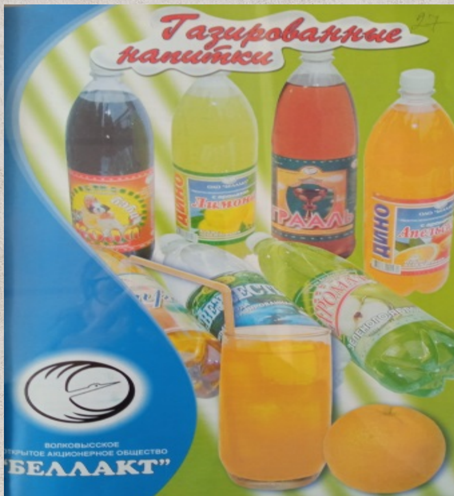
Иллюстрация 5. Ассортимент Волковысского ОАО «Беллакт».

Ассортимент продукции расширился: предприятие начало выпуск газированных безалкогольных напитков, кукурузных палочек. (Иллюстрация 5)